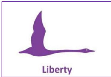
Klasse Hansa - Liberty