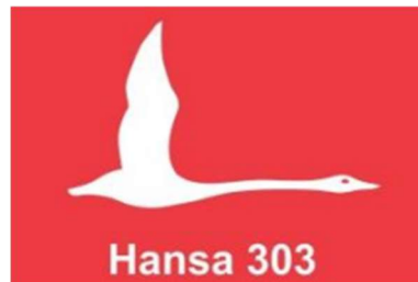
Klasse Hansa - 303 Single + Double